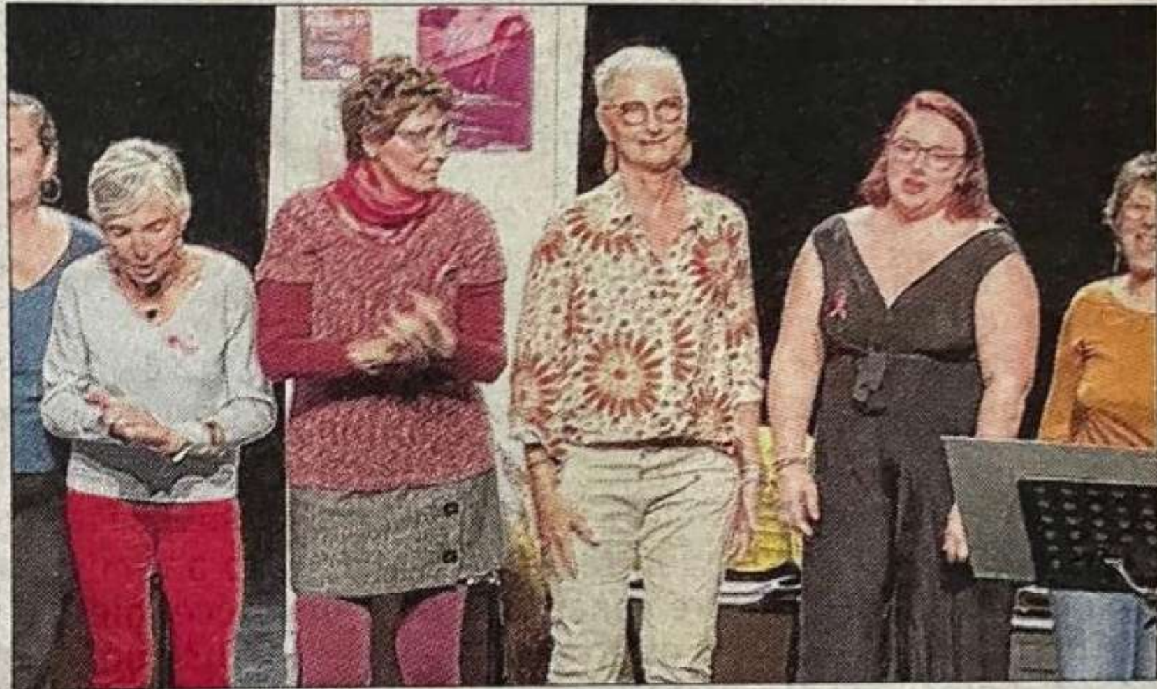
Voyage au bout de soi dans le cadre d'Octobre rose.